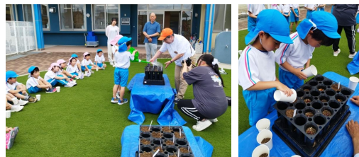
【春季募集苗木のスクールステイの様子】

県内の就学前教育施設（保育所・幼稚園・認定こども園等）、 小学校、中学校、高等学校、義務教育学校、 中等教育学校（前期・後期課程）、 特別支援学校（幼稚部・小学部・中学部・高等部）